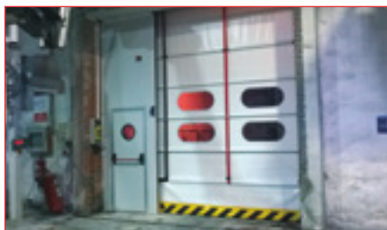
Montaje de cerramientos a medida en combinación con puertas industriales