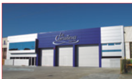
Reparaciones y mantenimientos de puertas seccionales