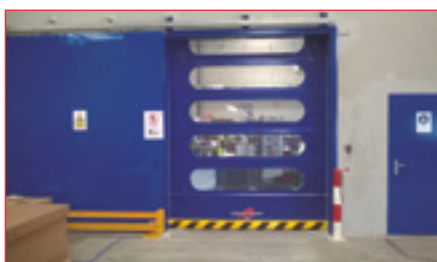
Reparaciones y mantenimientos de puertas rápidas

En momentos de máxima urgencia, de la misma manera ofrecemos a nuestros clientes contratos de mantenimiento de nuestros equipos industriales o de otras marcas.