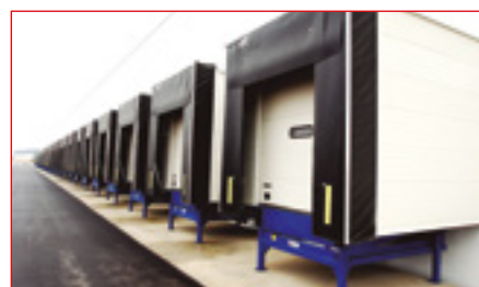
Reparaciones y mantenimientos de puntos de carga