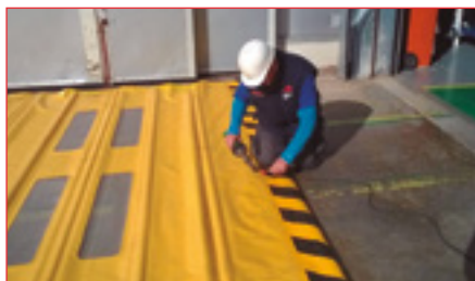
Reparaciones y sustitución de lonas para puertas rápidas